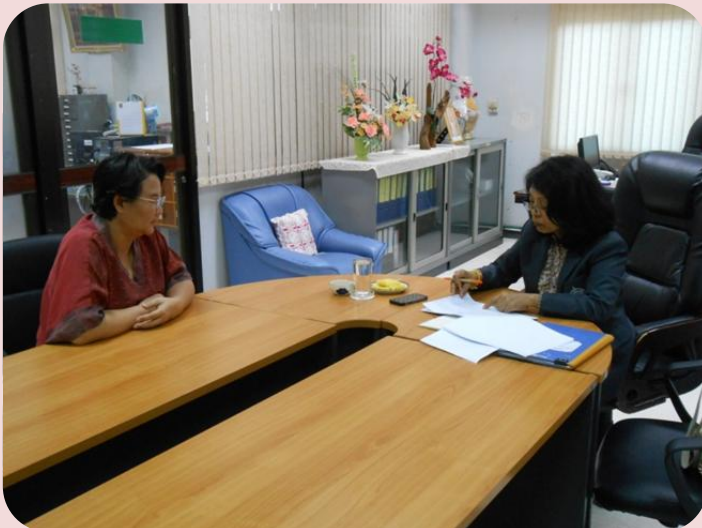
ส่วนประเมินราคาทรัพย์สิน