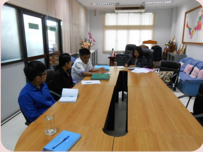
ส่วนจัดการที่ราชพัสดุ