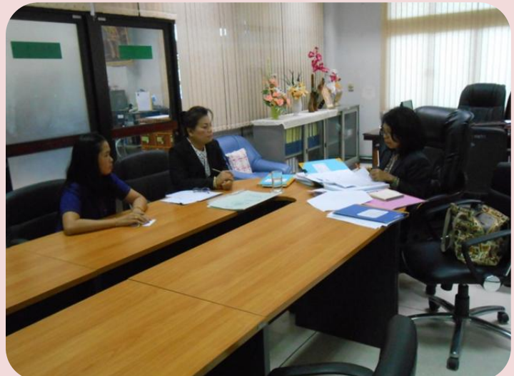
ส่วนบริหารงานทั่วไป