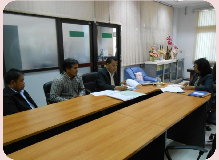
ส่วนจัดการฐานข้อมูล